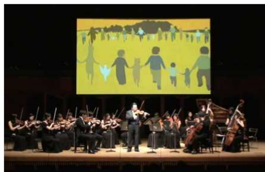
写真：北九州公演の様子